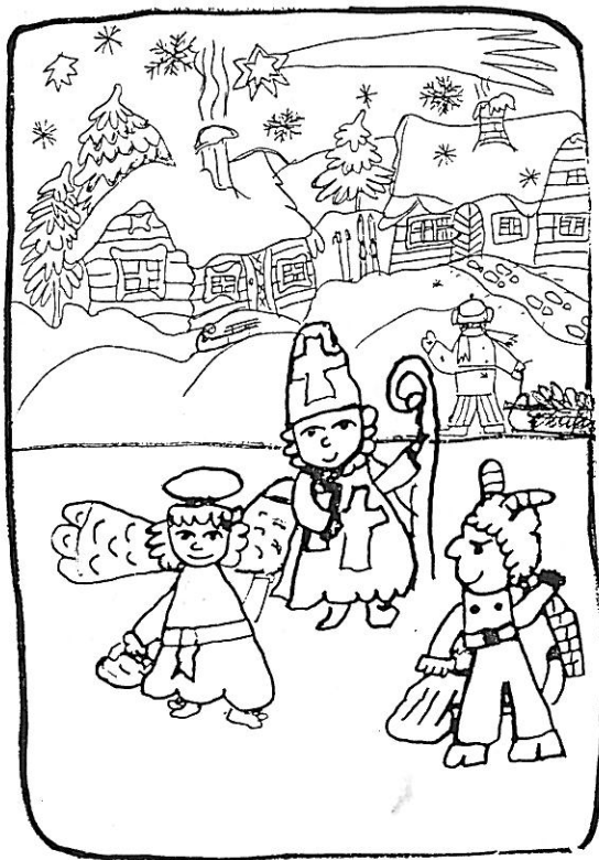
autorka kresby Tereza Davidová, 3. ročník